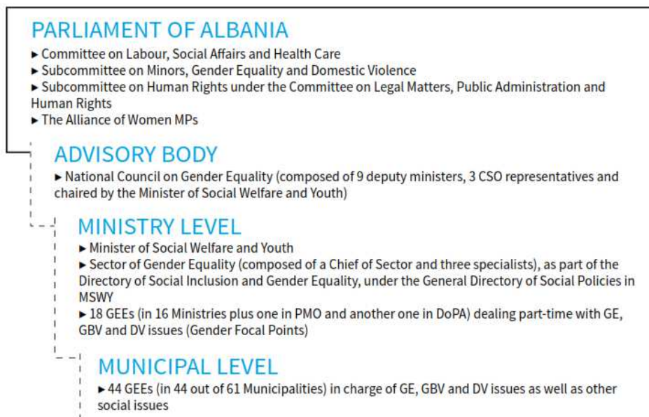
Figura 2: Struktura gjinore ne Shqiperi

Në Shqipëri ekzistojnë disa institucione dhe mekanizma në nivele të ndryshme në administratën publike që në tërësinë e tyre përbëjnë makinerinë gjinore kombëtare. Një pasqyrë është paraqitur në figurën më poshtë.